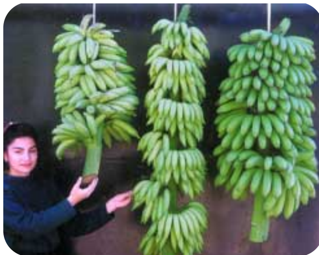
FHIA-01 (derecha) con sus progenitores Prata enano (izquierda) y SH-3142 (centro).

El peso de los dedos individuales oscila entre 192 y 220 gramos.