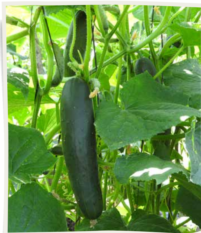
Fruto de pepino en el CEDEH, Comayagua, Comayagua.

El descarte de frutos por varias razones, estuvo dentro de los límites aceptables y el mayor porcentaje se dio por malformación de frutos. Se observó que el mayor porcentaje de frutos rayado de la categoría de menor calidad, Plain , es causada por el intenso viento durante la época de noviembre a febrero que provocan el rose de las hojas y el nailillo (ahijara) con el fruto. Esto también se puede reducir con los cortes a diario porque hay menos exposición de los frutos a las condiciones antes mencionadas.