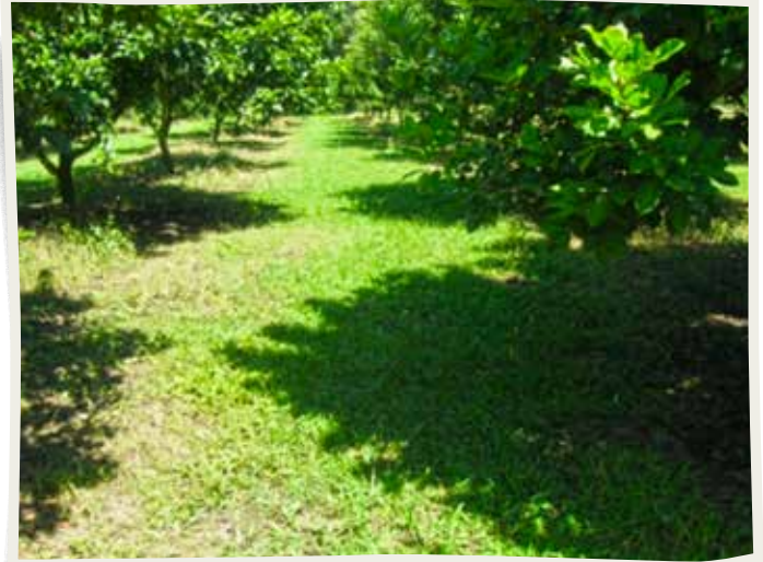
Plantación comercial de rambután.

mercado haciendo necesaria la búsqueda de otras rutas de comercialización o transformación. Como reto pendiente está aumentar el volumen que se envía hacia Europa y el envío de fruta explorando el mercado de Sudamérica.