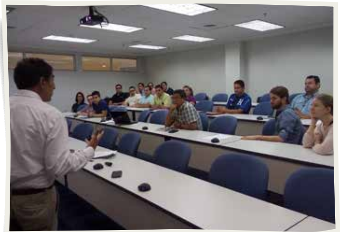
Personal de FHIA y UNITEC analizando líneas de acción prioritarias para el trabajo conjunto.