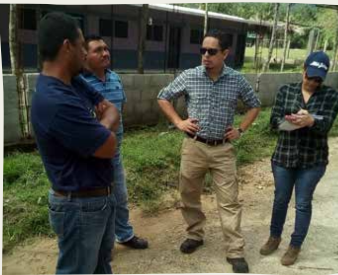
Técnicos de UNITEC dialogan con administradores de la microturbina en la comunidad de Las Quebradas, Tela, Atlántida.

Para lograr una amplia información en cuanto a las áreas en las que pueden unificar esfuerzos para el desarrollo, fue necesario realizar visitas de campo para conocer el estado actual de algunos de los temas propuestos. En el mes de enero del presente año, se realizó la visita con representantes de ambas instituciones a la comunidad de Las Quebradas en Tela, Atlántida, para que los expertos de UNITEC en el tema de energía conocieran el funcionamiento de una microturbina que provee energía eléctrica a esa comunidad, la cual fue instalada por la FHIA. Asimismo, se realizó una reunión de trabajo en las instalaciones de UNITEC para definir las líneas de trabajo en conjunto.