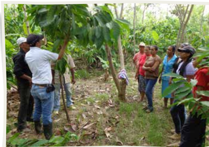
A través de las rutas de trabajo, los técnicos socializaron ante los pobladores los beneficios de producir cacao.

El Proyecto “Promoción de Sistemas Agroforestales de Alto Valor con Cacao en Honduras” también denominado Proyecto de Cacao FHIA-CANADÁ, inició en el mes de abril de 2010 y concluyó en el mes de marzo de 2017. Tras siete años de duración, los resultados obtenidos revelan un impulso histórico al sector cacaotero hondureño, por el suministro de calificados servicios de asistencia técnica, plantas de cacao, herramientas y otros servicios a los productores involucrados, lo cual permitió el establecimiento y rehabilitación de plantaciones de cacao fino y de aroma, contribuyó al aumento en la productividad del cultivo y en la calidad del cacao hondureño, brindando mayor acceso a mercados internacionales que además de mayores volúmenes requieren cacao de alta calidad. El proyecto