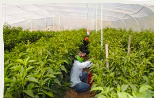
Interior del megatúnel con el cultivo de chile lamuyo.