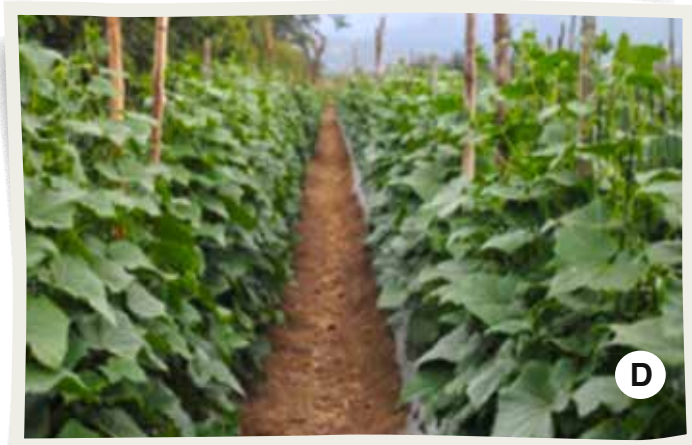
Proceso de tutorado: A) Colocación de rafia como espaldera para tutorar la planta, B) Primera labor de dirigir las guías hacia la rafia tutor, C) planta en crecimiento y D) planta desarrollada en espaldera.

Las variedades fueron sembradas el 4 de enero de 2016 mediante siembra directa colocando una semilla por postura a 0.20 m entre planta y 1.5 m entre hilera y un largo de cama de 12 m (área experimental de 18 m 2 ) con una densidad de 33,330 plantas/ha.