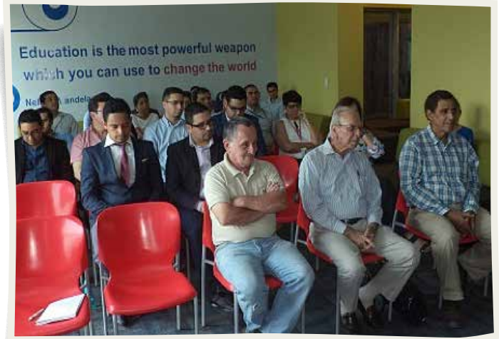
Con la firma de la Carta de Entendimiento se inician las acciones de trabajo entre ambas instituciones.