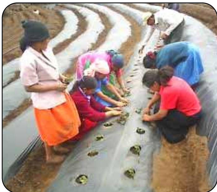
Productoras de San José, Guajiquiro, La Paz, realizando el trasplante de fresa en su parcela de producción.

Los técnicos de la FHIA responsables de este componente también visitan diariamente a la mayoría de los productores, buscando en forma participativa alternativas de solución a sus necesidades tecnológicas, y desarrollan un ambicioso programa de capacitación que incluye cursos cortos, seminarios, días de campo, giras de comercialización y demostraciones. En el 2006 este componente desarrolló 22 eventos de capacitación abordando aspectos agrónomos de los cultivos y otros temas colaterales como el manejo seguro de plaguicidas, administración de fincas y el ineludible tema de manejo apropiado de los recursos naturales, especialmente el suelo y el agua.