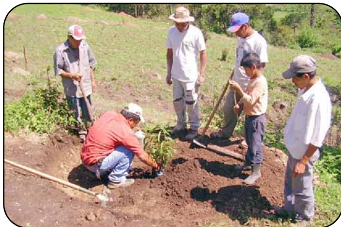
Los productores han recibido la asesoría para el trazado y siembra de frutales como el durazno.

En el caso de frutales de altura se sembraron un total de 3.8 hectáreas con los cultivos de durazno y ciruela roja en las comunidades de El Pelón y Zacate Blanco, mientras que en la zona baja de Jesús de Otoro se establecieron 3.8 hectáreas de plátano. Tomando en consideración que algunos frutales inician la producción a los 3-4 años de edad, en los casos que ha sido posible se han sembrado estos cultivos asociados con hortalizas para que los productores también obtengan ingresos económicos a corto plazo.