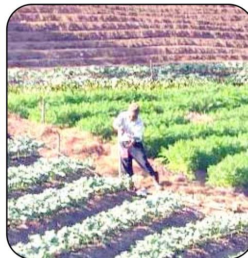
La producción de hortalizas se hace durante todo el año, haciendo rotación de cultivos.

Este componente también tiene como objetivo transferir tecnologías que mejoren la producción y productividad de las hortalizas en forma sostenible, para mejorar las condiciones de vida de los productores atendidos.