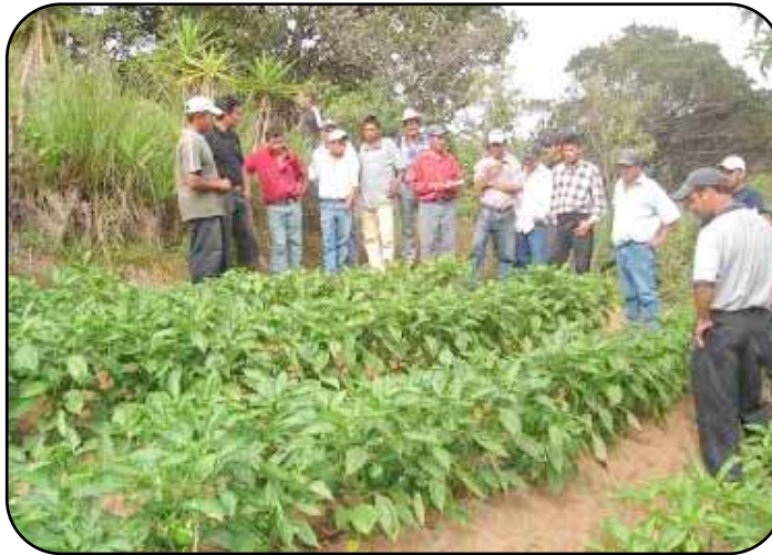
Productores participando en Día de Campo en lote comercial de chile dulce en Semane, Yamarangülla, Intibucá.

Durante el año 2006 la mayor parte de los productos se comercializaron a través de APRHOFI, lo cual les generó a los agricultores ingresos económicos por la cantidad de Lps. 2,866,204.00 por la venta de hortalizas y alrededor de Lps. 1,000,000.00 por la venta de frutas. Además, el producto obtenido en los lotes demostrativos