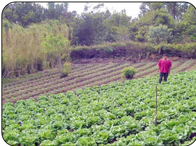
Parcela de producción de hortalizas en Zacate Blanco, Yamarangüila, Intibucá.

En esta zona se está trabajando con 44 productores, 37 de ellos residen en las comunidades de El Pelón y Zacate Blanco en el municipio de Yamarangüila y 7 productores en San Francisco y Santo Domingo en el municipio de Jesús de Otoro. En esta zona se está promoviendo la producción de hortalizas y frutales de clima frío, así como el establecimiento de especies maderables en linderos y cercos vivos. En el 2006 se manejaron 22 hectáreas de hortalizas en Yamarangüila, mientras que en el municipio de Jesús de Otoro se sembraron 6 hectáreas, para un total de 28 hectáreas en toda la zona. Tomando en consideración que en este proyecto se busca la mayor productividad posible, se instalaron pequeños sistemas de riego por goteo en 7.5 hectáreas, y en una hectárea adicional se instaló un sistema de riego por aspersión. En el 2007 se está trabajando intensamente para que la totalidad de los productores instalen sus sistemas de riego.