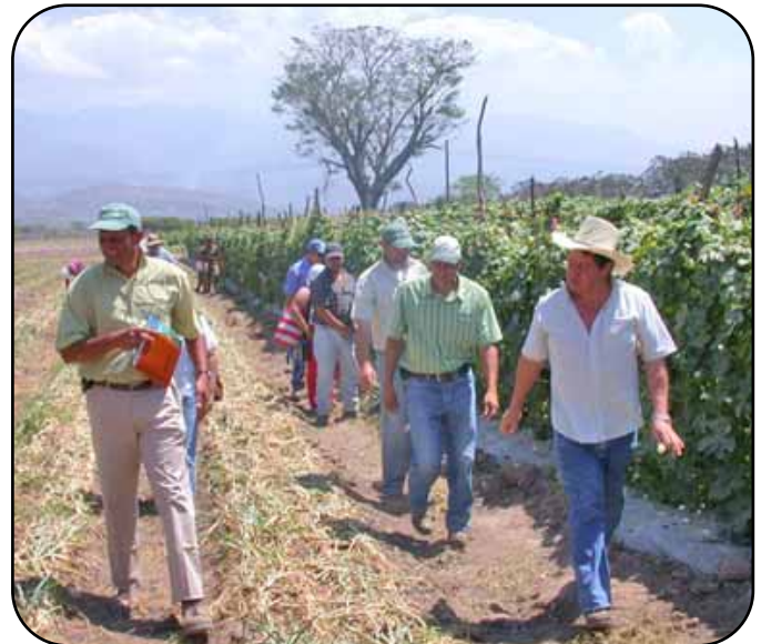
Técnicos y productores recorrieron los lotes experimentales.

Bajo la coordinación de los técnicos de la FHIA, los participantes hicieron un recorrido por la estación experimental donde pudieron observar el manejo que se le da a cultivos nuevos como el Snake Gourd y la Tindora, de origen asiático y con gran potencial para la exportación al mercado norteamericano. También observaron el comportamiento de los cultivos de bangaña y cundeamor cuando se utilizan diferentes tipos de tutorado para su crecimiento; así como el comportamiento que muestra el cultivo