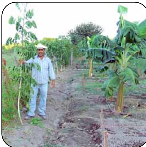
El Carreto es una de las especies adaptadas a las condiciones edafoclimáticas de la zona y aceptada por los productores como fuente de energía y para otros usos.

En lo relacionado con especies maderables, durante el 2006 se sembraron 4,842 plantas de distintas especies forestales adaptadas a la zona, bajo la modalidad de árboles en línea ya sea en linderos o en divisiones internas de las fincas, alcanzando una longitud de 12 kilómetros lineales.