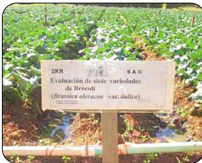
Evaluación de variedades de broccoli en la Estación Experimental.

Un proyecto de esta naturaleza requiere de innovaciones tecnológicas que hagan eficientes, productivos y sostenibles los sistemas de producción. Es por esta razón que la FHIA mantiene un constante componente de generación y validación de tecnologías que incluye la ejecución de proyectos específicos de investigación en la Estación Experimental "Santa Catarina" de la SAG, ubicada en La Esperanza, Intibucá, así como el establecimiento y evaluación de cultivos y/o tecnologías específicas mediante lotes demostrativos en las fincas de los agricultores.