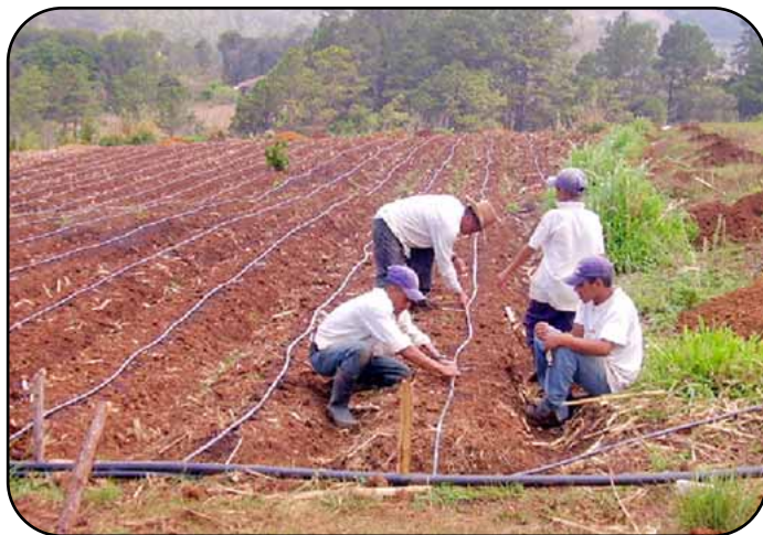
Instalación de sistema de riego por goteo en parcela de producción de hortalizas.

En el caso de frutales de altura se sembraron un total de 3.8 hectáreas con los cultivos de durazno y ciruela roja en las comunidades de El Pelón y Zacate Blanco, mientras que en la zona baja de Jesús de Otoro se establecieron 3.8 hectáreas de plátano. Tomando en consideración que algunos frutales inician la producción a los 3-4 años de edad, en los casos que ha sido posible se han sembrado estos cultivos asociados con hortalizas para que los productores también obtengan ingresos económicos a corto plazo.