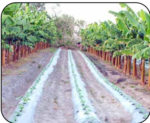
El plátano es un cultivo no tradicional en el municipio de Jesús de Otoro. Se siembra con buena tecnología y en asocio con cultivos hortícolas.

En lo relacionado con especies maderables, durante el 2006 se sembraron 4,842 plantas de distintas especies forestales adaptadas a la zona, bajo la modalidad de árboles en línea ya sea en linderos o en divisiones internas de las fincas, alcanzando una longitud de 12 kilómetros lineales.