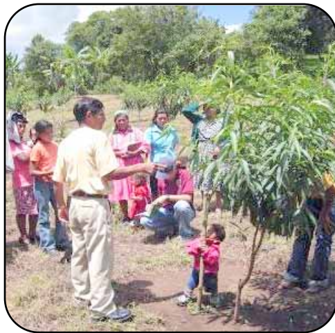
Productor líder en Día de Campo sobre la producción de durazno en San José, La Paz.

El objetivo específico de este componente es transferir innovaciones tecnológicas para incrementar la producción y productividad de los frutales de clima frío en forma sostenible, mejorar los ingresos económicos y las condiciones de vida de los productores involucrados.