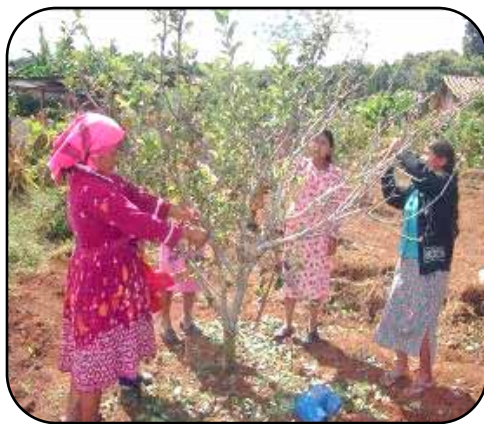
Productoras atendidas por la FHIA realizando poda foliar en el cultivo de manzana.

En todas las comunidades intervenidas se promueve el desarrollo de siete especies de frutales: manzana, durazno, aguacate Hass, membrillo, ciruela, nectarina y pera, por su orden de importancia, respectivamente. Durante el año 2006 se atendieron 686 pequeños productores que cultivan los siete frutales antes mencionados en un área total de 72 hectáreas (103 manzanas). El 85% de los productores disponen de sistemas de riego por goteo y los demás utilizan riego por gravedad; cada productor maneja en promedio una área de 1,050 metros cuadrados, cultivada con uno o varios de los cultivos mencionados.