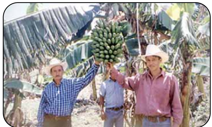
Pequeños productores hondureños y de otros países encuentran en los híbridos de banano y plátano de la FHIA, una fuente de nutrientes para contribuir a la seguridad alimentaria.

América Latina, se está desarrollando un proyecto innovador orientado entre otras cosas, a crear híbridos de banano tipo Cavendish con resistencia a la Sigatoka negra y al Mal de Panamá, con resultados hasta ahora promisorios.