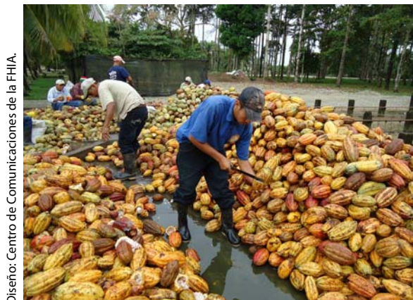
Diseño: Centro de Comunicaciones de la FHIA.